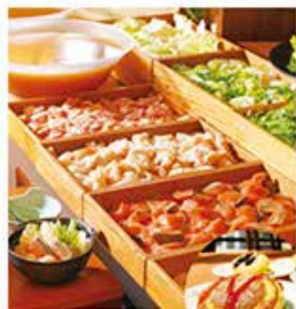
ランチレストラン 瀬戸内マルシェ 瀬戸内の食をテーマにしたランチ。