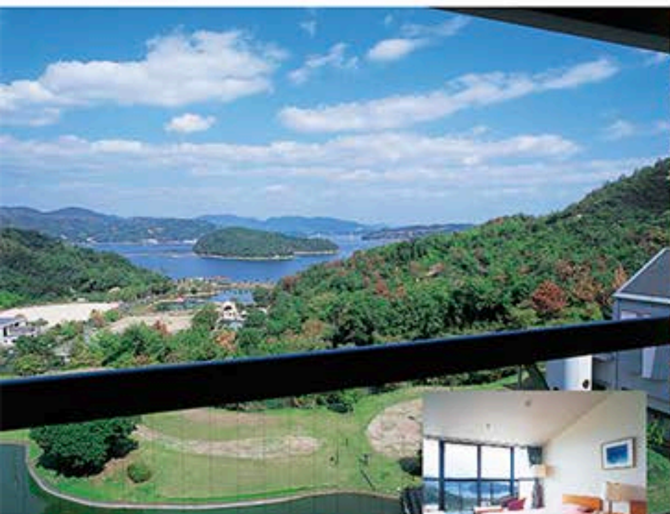
客室の窓から瀬戸内海を一望できます 旅のオーシャンビューをひとりじめ。