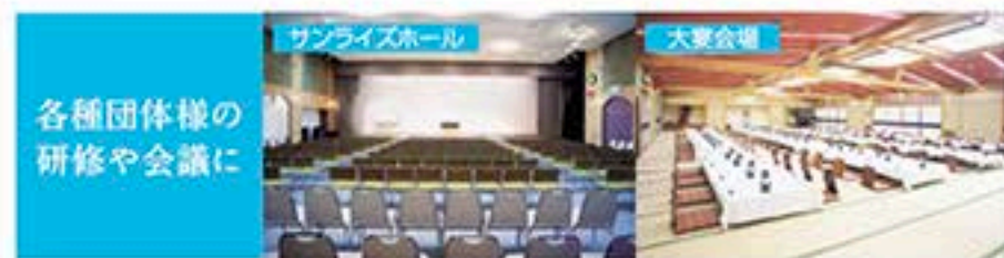
各種団体様の 研修や会議に

平天然温泉 トゴール湯 体を芯から温めるまろやかなお湯で、 肌への刺激を和らげ、さっぱりした 爽快感が得られます。