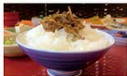
せとの朝ごはん 名物の佃煮や干物、お漬物など、和洋折衷の バイキングメニュー。